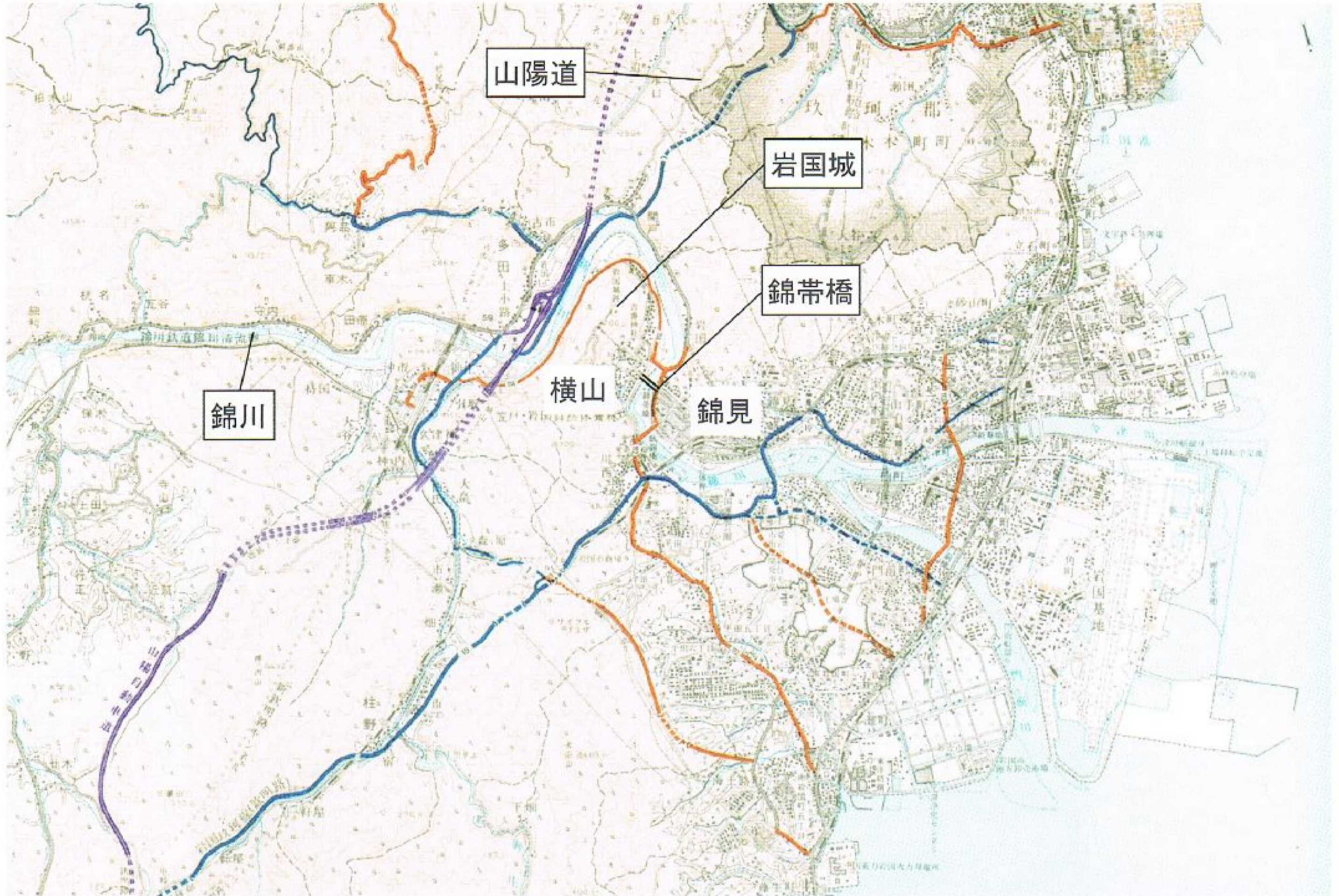
図-1 岩国市管内図(山口県岩国市役所, 2006)