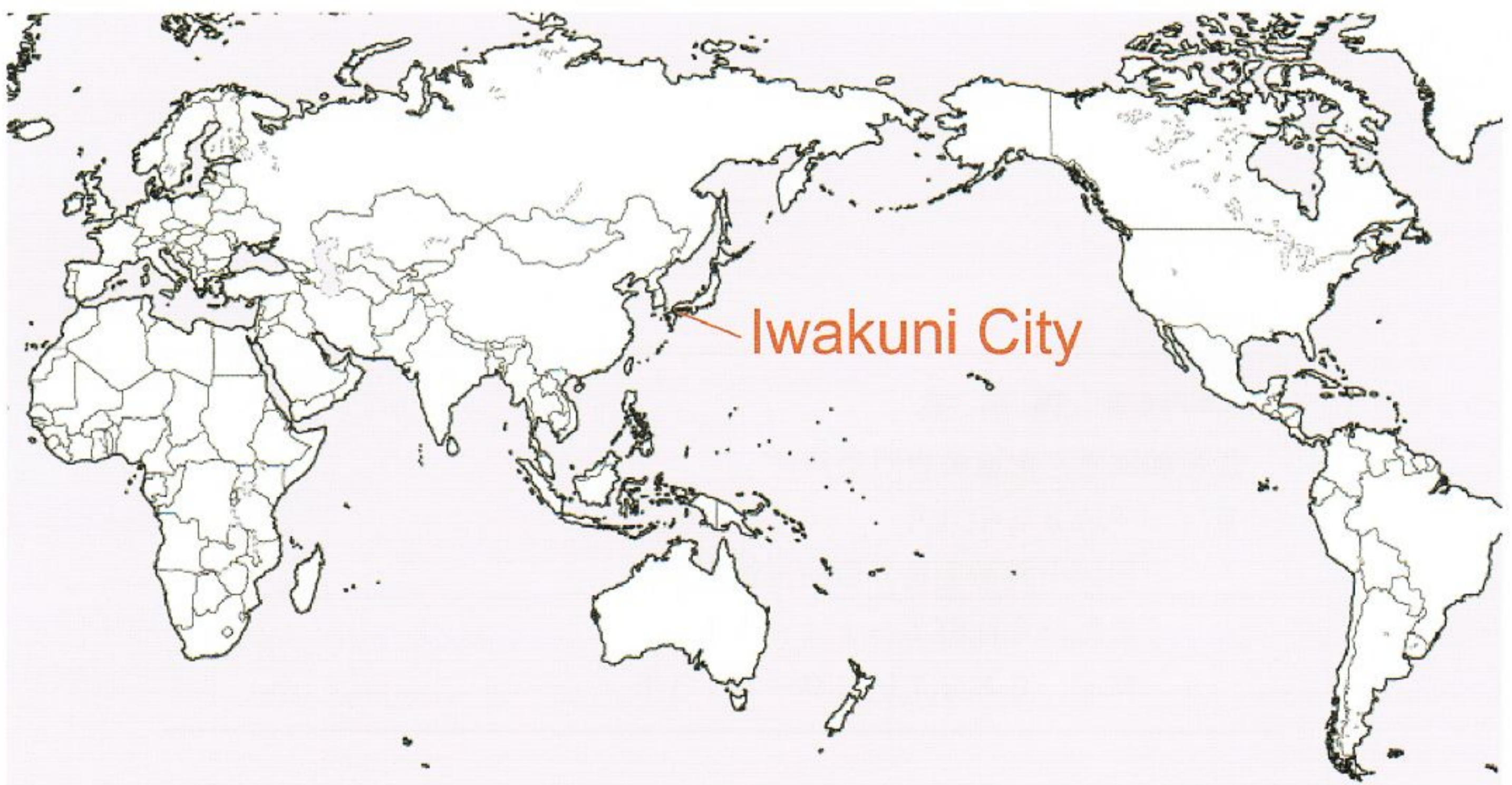
図-2 世界の中の岩国